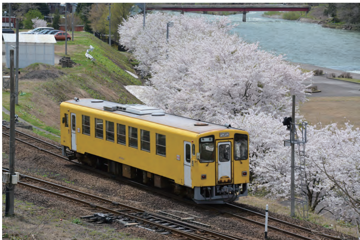
阿仁合駅すぐの河川公園と桜

長かった冬が過ぎ、待ちに待った一年に一度のお花見シーズンがやってきました。定番の花見スポットからまだ一度も訪れたことのないエリアまで、内陸線沿線の花の名所をご紹介します。そして、車窓からもたくさんの花を楽しむことができますので、ぜひお出かけください。