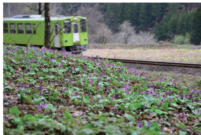
八津駅周辺の線路脇のかたくり群生地

くら号」「カタクリ号」の運行や急行「もりよし」号の八津駅臨時停車、一部列車の車両の増結などを行います。 【くら号】運行日 4/27、29、5/3、6 鷹巣9時53分発(角館行)、角館14時27分発(弘前行) 【カタクリ号】運行日 4/20、29 角館10時30分発(八津行)、八津14分発(角館行) 【もりよし号】八津駅臨時停車 4/20、5/6