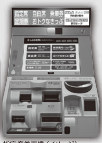
指定席券売機 (イメージ)