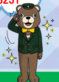
内陸線公式キャラ じゅうべえ