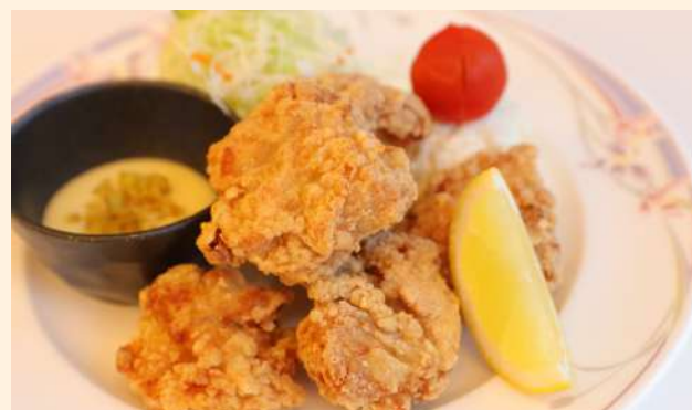
唐揚げ定食 塩麴マヨ付き※はちみつ使用 Fried chicken set meal / 炸雞套餐 (5個) ¥1,200- ハーフ3個(Half Size)…¥750