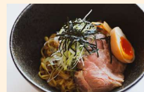
油そば Oil soba / 油蕎麥麵 ¥900-