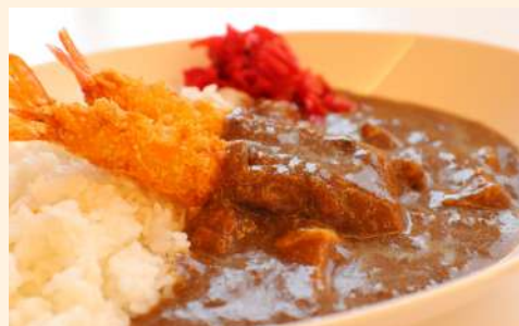
海老フライカレー Fried shrimp curry / 炸蝦咖喱飯 ¥1,100 ハーフ(Half Size)…¥700-