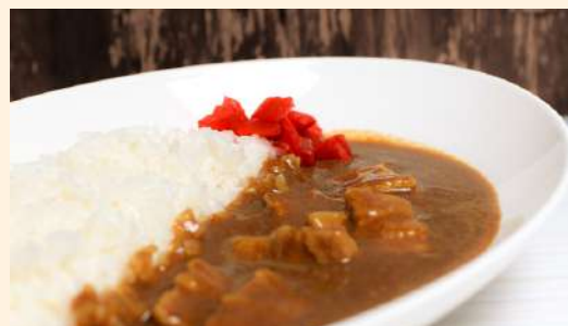
ポークカレー Pork curry / 豬肉咖喱 ¥800 ハーフ(Half Size)… ¥550-

* 定食：ご飯・味噌汁・小鉢付き / * Set meals : Comes with rice, miso soup, and a small side dish / * 套餐：附米飯、味噌湯、小菜 *