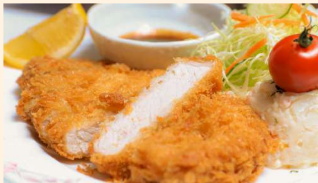
阿仁みそソースの とんかつ定食 Pork cutlet set meal / 炸豬排套餐 ¥1,300-