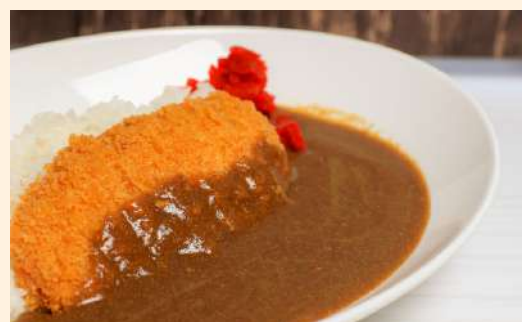
カツカレー Katsu curry / 炸豬排咖喱飯 ¥1,200-