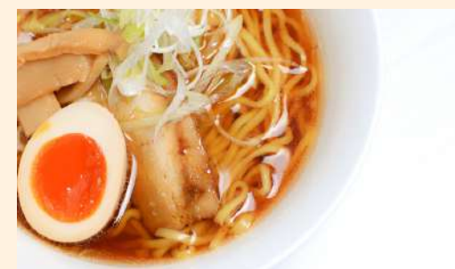
醤油らーめん Soy-sauce Ramen / 醬油拉麵 ¥800-