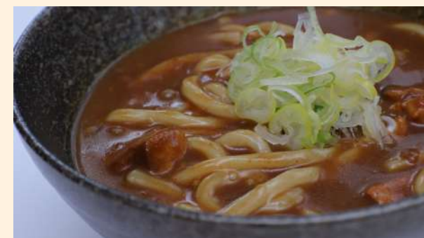
カレーうどん ¥800 curry noodles/咖喱烏龍麵