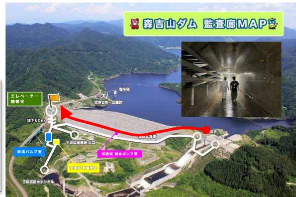
森吉山ダム 監査廊MAP