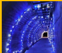
監査廊 イルミネーション