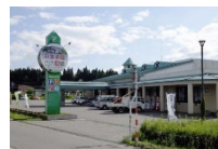
森吉山ダムカレー