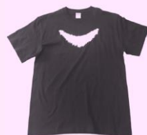
（ユニフォームの クマTシャツ）